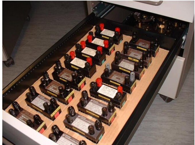
Bild XV.1 Festwiderstände Burster 1240. Anschluss in 4-Draht Technik

Die Quelle Keithley 263 (s. Kapitel III) kann neben direkter Spannungserzeugung (oder Erzeugung am Multifunktionskalibrator 5700A) im Gleichstrommodus zusammen mit kalibrierten Widerständen dazu genutzt werden Kleinstspannungen indirekt zu liefern. Mit den bekannten Zusammenhängen des Ohmschen Gesetzes können dabei die entsprechenden Spannungspunkte errechnet werden. An induktivitäts- und thermospannungsarmen Festwiderständen (z.B. Burster 1240, Bild XV.1) erfolgt der Anschluss der Stromquelle wie in Bid XV.2 zusammen mit dem Kalibriergegenstand. Gezeigt ist die Vergleichsmessung am eigenen Nanovoltmeter Keithley 181. Durch die hohe Compliance Spannung von 12 V des Stromtreibers wird der Ausgangsstrom fast unabhängig vom Lastwiderstand immer konstant gehalten. Im Millivoltbereich kann die Quelle also bedenkenlos eingesetzt werden. Sehr kleine Spannungen erfordern eine Beruhigungszeit von ca. 2 Minuten und den Einsatz der Zero Funktion an der Quelle um ggf. Offsetspannungen am Messobjekt zu ermitteln.