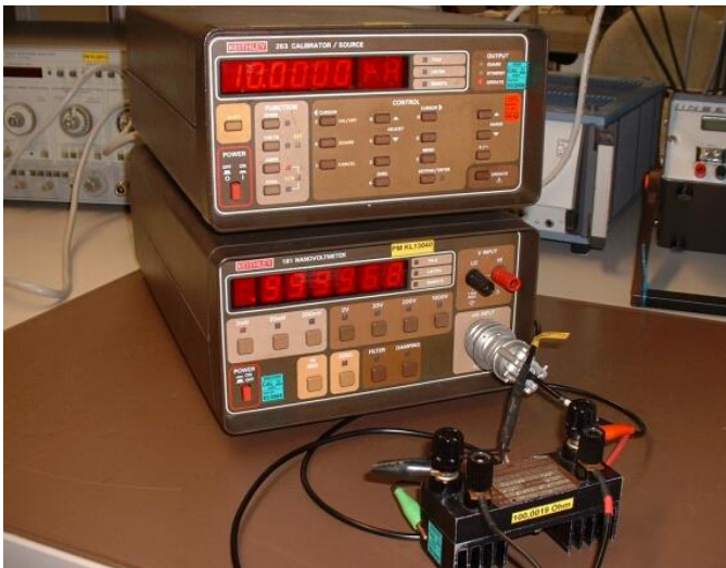
Bild XV.2 - Millivoltkalibrierung an Stromquelle Keithley 263: An der Quelle eingestellt sind 10 \mu\text{A} an 100,0019 \Omega . Mit dem korrigierten Wert aus dem Kalibrierschein (9,99884 \mu\text{A} ) ergibt sich rechnerisch eine Spannung 0,999902 mV. Das eigene Nanovoltmeter zeigt 0,99997 mV. Die Ergebnisse dieser Vergleichsmessungen werden als Reproduktionsauswertungen im Messunsicherheitsbudget berücksichtigt.

Gute Ergebnisse erzielt dieses Messverfahren für die Erzeugung von 1 \mu\text{V} bis 200 mV bei Verwendung von Messströmen von >20 \text{ nA} bis 20 \mu\text{A} über Widerständen von 100 \Omega bis 10 k \Omega . Lässt