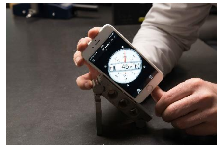
Das Smartphone wird an das Sinuslineal gehalten.